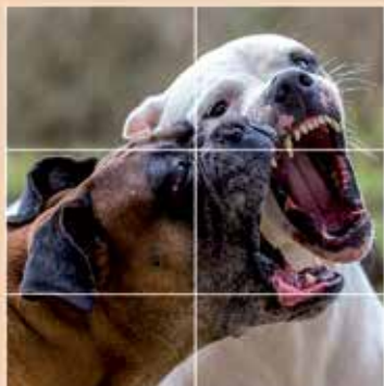
HA VESZÉLYES ÁLLATOKAT LÁT

A HELPYNET AZ ALÁBBI ESETEKRE NYÚJT MEGOLDÁST: