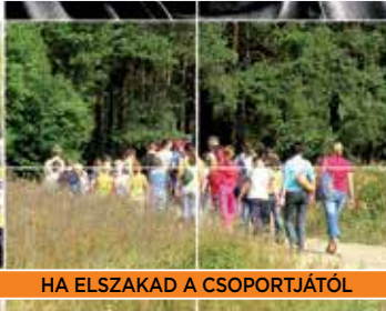
HA ELSZAKAD A CSOPORTJÁTÓL

HA A GYERMEK ILYEN HELYZETBE KERÜL, AZONNAL NYOMJA MEG AZ S.O.S. GOMBOT!