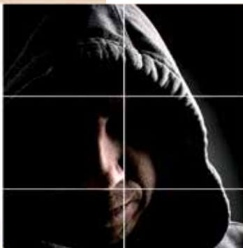
HA VESZÉLYESNEK TŰNŐ EMBERT LÁT